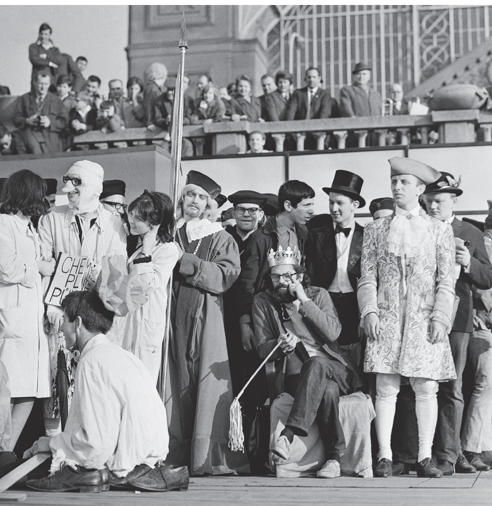
Allen Ginsberg se stal králem majálesu 1. května 1965. O několik dnů později byl z Československa vyhoštěn