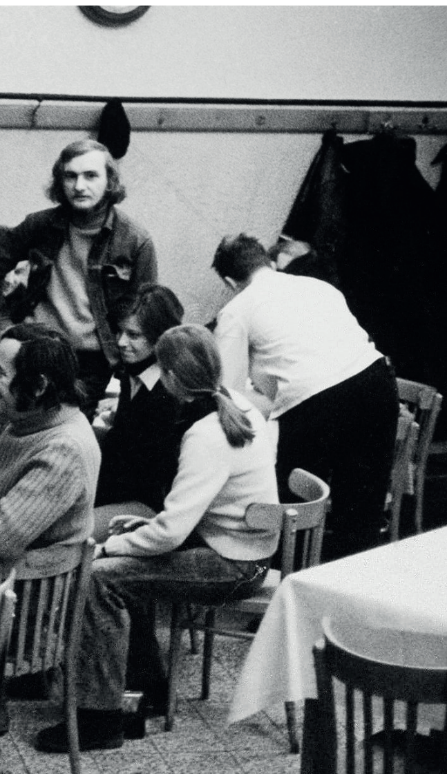
Křižovnická škola čistého humoru bez vtípu vznikla v roce 1963 v hospodě U Křižovníků