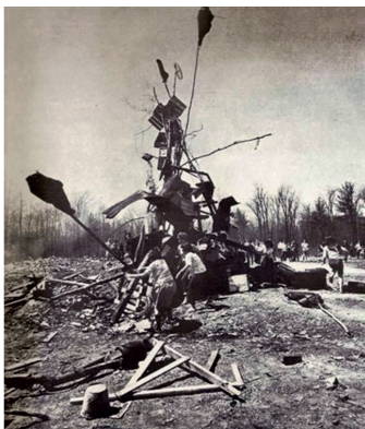
Fotografie z happeningu Allana Kaprowa „ Household “, 1964 ( How To Make a Happening )