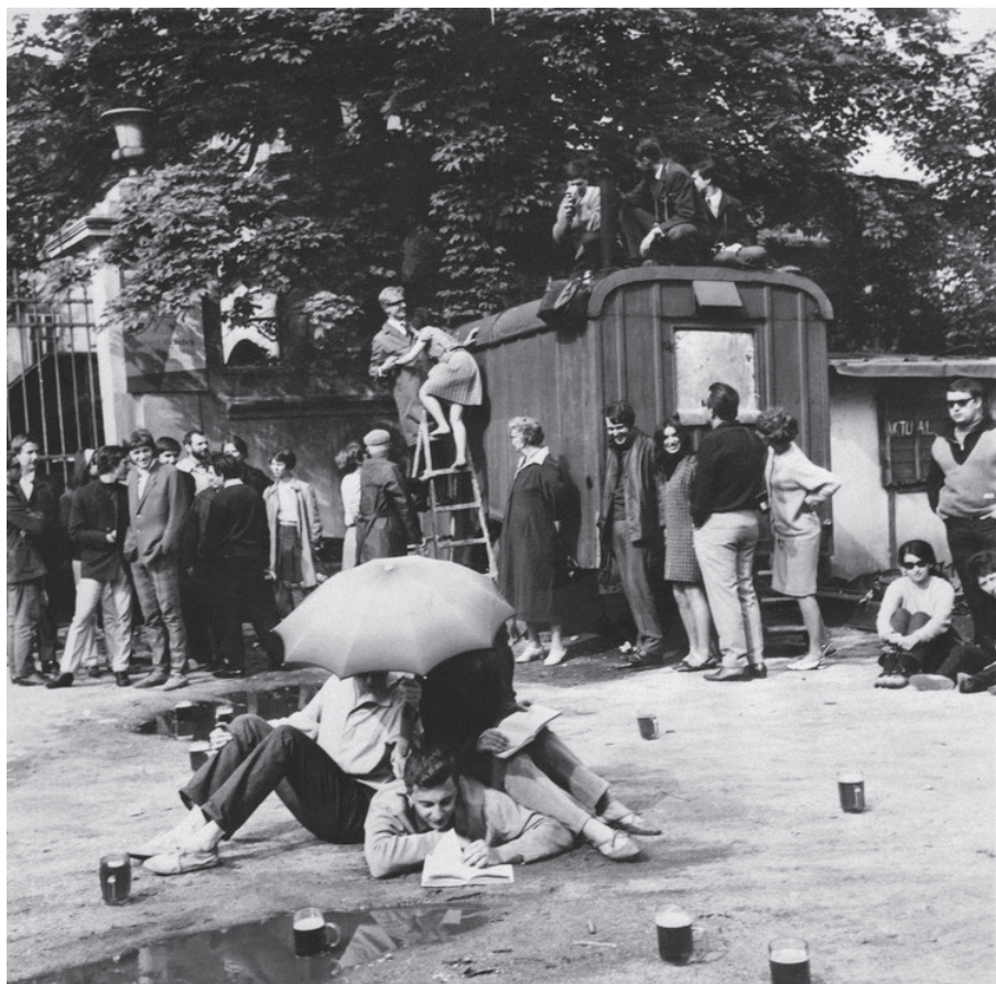
Happening Eugena Brikiuse „Pivní zátíší 3“, 1967