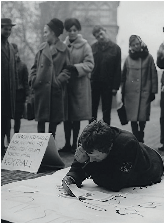
Happening Milana Knížáka „Demonstrace jednoho“, 1965