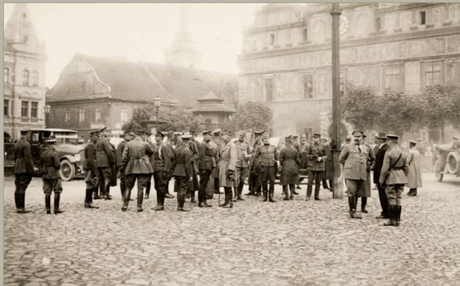
Vzdušný snímek ze studijní cesty Hlavního štábu západočeským pohraničím a jihozápadním Plzeňskem z 19.–24. května 1924. Fotografie vznikla během zastávky ve Stříbrě 23. května 1924.

Školící a výcvikové činnosti z roku 1923 dokládají jejich další metodické zdokonalení a velice úzkou věcnou a bezprostřední časovou provázanost společného cvičení Hlavního štábu se studijní cestou tohoto