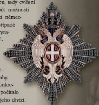
Generál V. hodnostní třídy Jan Syrový (na portrétu ještě z počátku 20. let) s hvězdou srbského Řádu bílého orla 2. třídy, který obdržel v roce 1923. Nejvyšší třída tohoto řádu mu byla udělena o deset let později.

ústředního orgánu velení branné moci. Společné cvičení Hlavního štábu, tedy cvičení na mapách, zkoumalo opět možnosti obrany českých zemí proti německému napadení. V tomto případě se pracovalo s hypotézou vyražení Reichswehru z Kladského výběžku všeobecně jihozápadním směrem s cílem zatlačit československé obránce a z uvedeného směru dosáhnout Prahy. Námět v tomto případě konkretizoval nepřítel tak, že se počítalo s nasazením pěti až šesti jeho divizí. Československá branná moc vyčleňovala proti severní frontě dvě armády. Jednu v Čechách s pěti divizemi a jednu na Moravě se dvěma divizemi a jednou jezdeckou brigádou. Cíl tohoto cvičení spočíval v analýze podmínek pro součinnost obou armád obránce za situace, kdy by moravská armáda nemohla být kvůli přerušnému železničnímu spojení dopravena do Čech jinými cestami. Po zastavení nepřátelského postupu se počítalo se zahájením protiútoků a přenosem bojové činnosti na území agresora. Jan Syrový dostal v tomto konceptu za úkol velet armádě v Čechách. Cvičení trvalo od poloviny února do 2. června, kdy Mittelhausser svolal do Prahy zúčastněné vyšší velitele k rozpravě. Cvičení opět přineslo všem řadu