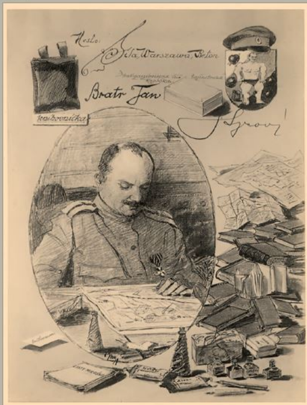
Prap. Jan Syrový na kresebné zobrazení některého z jeho spolubojovníků. Kresba nese v horní části snímku text: „Heslo: Síla, Varšava, Beton.“ Tato slova jednak dokumentují, odkud se Jan Syrový vydal do České družiny, a jednak skutečnost, že její jeho spolubojovníci pokládali právem za nezodolného muže, který se nezalekne před nebezpečím.