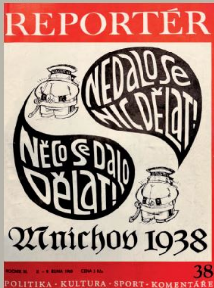
Obálka časopisu Reportér z října 1968 s karikaturou arm. gen. Jana Syrového.

armádu. A proč tedy musela složit zbraně bez výstřelu? „Obrana republiky byla koncipována na pomoci našich tehdejších spojenců. Tak jsme také zaměřovali svou zahraniční politiku. V kritických dnech jsem proto poslal mého pobočníka generála Píku do spojeneckých zemí, aby sondoval poslední možnosti pomoci. Zůstali jsme však sami,“ pravil Syrový s tím, že kdyby spojenci ČSR pomohli, tak bychom v žádném případě na mnichovský diktát nepřistoupili. „Opakují, že ještě než jsem šel na křeslo ministerského předsedy, předpokládal jsem,