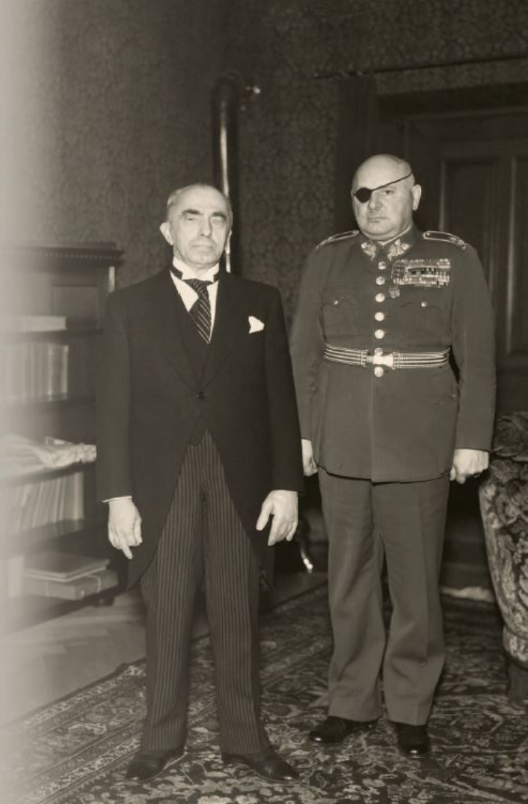
JUDr. Emil Hácha, nově zvolený prezident republiky Česko-Slovenské společně s předsedou vlády arm. gen. Janem Syrovým.

„Osoba Háchova nepůsobila na mne dojmem silného muže,“ uvedl později Syrový s tím, že však nejlépe vyhovoval stávajícím politickým poměrům. 48 Média přijala Háchovu volbu vesměs kladně, domácí i zahraniční. Šéfredaktor Lidových novin Eduard Bass upozornil na symboliku předání nejvyšší funkce generálem Syrovým soudci Háchovi: „Voják uvedl v čelo státu soudce. Velká a správná rozhodnutí mají vždy povahu symbolu. Můžeme být uspokojeni obrazem, jenž se nám podává tím, že moc staví na nejvyšší místo právo. To je náš český řád a díky za to, že zůstal neporušen. Jinde učí jinak, ale na duchovním nebi naší české vlasti nejvýše trůní spravedlnost. V naší řeči jsou právo a pravda z téhož kořene. Pravda vítězí, znamená nám stejně, že právo a spravedlnost vítězí.“ 49 Prezidentu Emilu Háchovi, který si nechal výrazně snížit prezidentský plat a odmítal, aby na úřadech a ve školách visel jeho portrét, blahopřál osobním dopisem i Edvard Beneš z emigrace.