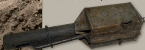
Ruský útočný granát.

jistě a sebevědomě. Kerenského ofenziva byla spuštěna 29. června 1917. Začala mohutnou dělostřeleckou přípravou. Vojska XLIX. armádního sboru měla vyrazit do útoku zrána 2. července. Čas vyražení Československé střelecké brigády byl stanoven na 9. hodinu ranní. Ppor. Jan Syrový stále kontroloval svou rotu a dbal na udržení spojení se štábem i sousedními rotami. Úkol jeho roty i celého II. praporu spočíval v podpoře a ochraně levého boku I. praporu. Úderné skupiny II. praporu byly připraveny k vyražení z operního bodu, zvaného lunet Káta, jenž se nacházel pouhých 600 kroků od předního okraje rakousko-uherské obrany. Intenzivní dělostřelecká palba nepřítele narušovala telefonní spojení, a tak se Jan Syrový rozhodl pro osobní kontakt s velitelem sousední roty Otakarem Husákem, jenž se těsně před útokem zdržoval na polní