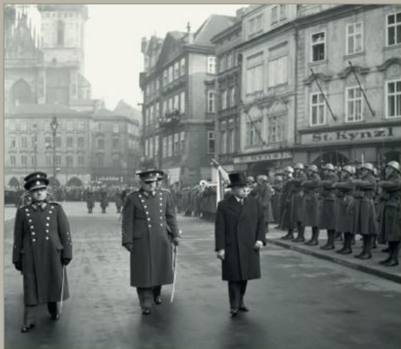
Prezident JUDr. Emil Hácha po volbě 30. listopadu 1938 před nastoupenou vojenskou jednotkou u Staroměstské radnice v doprovodu armádních generálů Jana Syrového a Ludvíka Krejčího.

kulturního rozhledu, který nedávno ovdověl, jehož širší veřejnost tolik neznala, ale oceňovány byly jeho spravedlivé rozsudky. Konzervativce pevně rostlý s demokratickým právním státem se stal oním přijatelným kandidátem, potíž spočívala v tom, že nikterak neusiloval v šestašedesáti letech o prezidentský úřad.