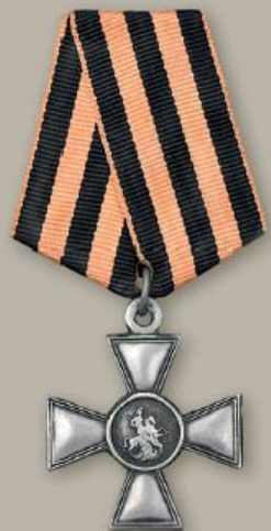
Kříž sv. Jiří 4. stupně.