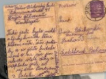
Mnohá korespondenční listky zapomených lidických dětí dorazila do postovního úřadu v prvním červnovém týdnu 1942

Transport 88 lidických dětí odjel z kladenské reálky dvěma autobusy do Lovosic, kde nastoupil do vlaku, jenž děti 13. června 1942 dopravil do tábora sídliho v komplexu bývalé textilní továrny v Gneiseustraße 41 v Lodži (Litvansztráß). Jejich příjezd předznamenával telegram z pražského úřadu Horsta Böhmeho konající slovy: „... děti s sebou vezou jen to, co mají na sobě. Největší záležitostí péče není Zdravotní.“ Ově péče bylo skutečně minimum. Děti dostávaly málo jídla a několik malých míramek, a která se starala starší děvčata, neustále plakala hladem. Děti spaly na belé zemi, přikrývaly se kabáty, pokud nějaké z domova měly. Trpěly nedostatkem hygieny i nemocemi. Na rozkaz velitelství tábora jim nesmělo být poskytována žádná lékařská péče.