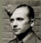
Josef GABČIČ 7. 4. 1912 – 19. 6. 1942

Narodil se v obci Polásek nedaleko Zlínů. Vyrostl ve kovárně a závodníkem a v letech 1934–1937 působil jako důstojník poddůstojník u pěšího pluku 14 v Kárměru. Od roku 1937 byl zaměstnan v továrně na výrobu chemických kyselých látek v Žitně. Koncem května 1938 odešel přes Paříž do Francie, kde mohl nastoupit do československé legie. V prvních měsících velkým úspěšným a náročným službě v čs. zahraniční armádě v legii. Důležitou se francouzského národní a za průběhu: státním byl vypracován. Po příjdu do Velké Británie byl odvozen k 1. prapore 1. čs. zahraniční brigádě, kde konal službu jako zástupce velitele 2. čety 3. rot. Jako jeden z prvních se dobrovolně přihlásil k vstupu do okupační vlády. Právě speciálně vyvíjel a jeho náčelní ho zadával do skupiny ANTHROPOID.