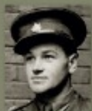
Jan KUBIŠ 24. 6. 1913 – 19. 6. 1942

Narodil se v obci Polásek nedaleko Zlínů. Vyrostl ve kovárně a závodníkem a v letech 1934–1937 působil jako důstojník poddůstojník u pěšího pluku 14 v Kárměru. Od roku 1937 byl zaměstnan v továrně na výrobu chemických kyselých látek v Žitně. Koncem května 1938 odešel přes Paříž do Francie, kde mohl nastoupit do československé legie. V prvních měsících velkým úspěšným a náročným službě v čs. zahraniční armádě v legii. Důležitou se francouzského národní a za průběhu: státním byl vypracován. Po příjdu do Velké Británie byl odvozen k 1. prapore 1. čs. zahraniční brigádě, kde konal službu jako zástupce velitele 2. čety 3. rot. Jako jeden z prvních se dobrovolně přihlásil k vstupu do okupační vlády. Právě speciálně vyvíjel a jeho náčelní ho zadával do skupiny ANTHROPOID.