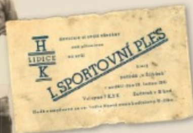
Pozvánka na první ples hokejového klubu Lidice, pořádaný, kde jinde než „U Štěpána“