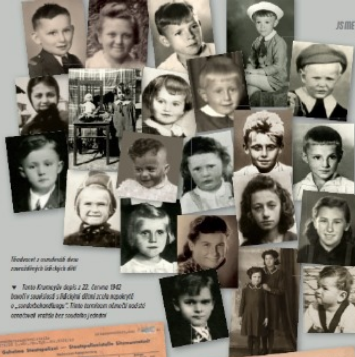
Několcí z zanechaných dětských zápisů

▼ Tento Krumejev dopis z 22. června 1942 dovořil souhlasit s lidickými dětmi zcela napokýřel o „zdravokondičku“. Tímto stanovem odnětí vadit označoval vstřle bez souhlasu jednatel