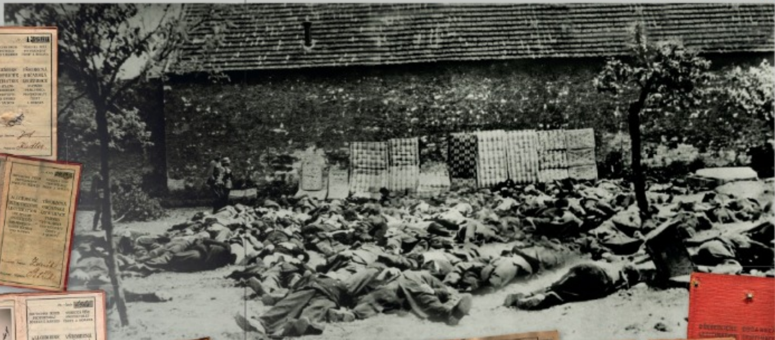
Zalévání, svedení kulkami prořezání doklady lidických mužů